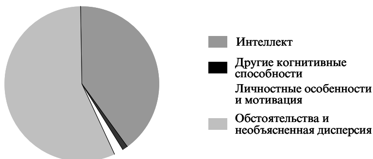
Предикторы обращения с техникой в рамках Армейского проекта А

Если же мы возьмем такую сторону военной службы, как дисциплина, которая в меньшей степени основана на сложной когнитивной деятельности и в большей — на социальных отношениях, то результат окажется совершенно иным. Роль интеллекта там весьма мала и объясняет 2,5% дисперсии. Еще меньше вклад других когнитивных факторов. В то же время темпераментальные и личностные особенности могут объяснить чуть больше 10% вариации. Характерно, что необъясненная дисперсия оказывается выше в этом случае, чем в предыдущем, т. е. тогда, когда основную роль играют личностные