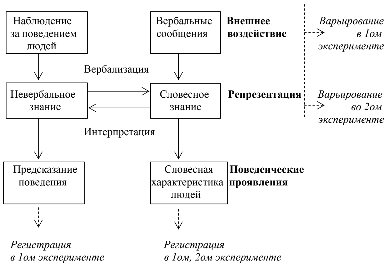
Рис. 1. Модель двух типов репрезентации социального знания и схема её экспериментальной проверки

В основу диссертационной работы легла модель соотношения вербализованного и невербализованного компонентов в структуре социального интеллекта, предложенная Д. В. Ушаковым (рисунок 1).